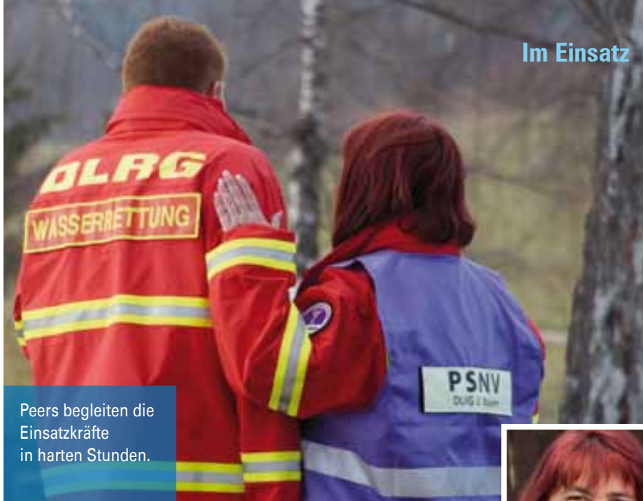
Peers begleiten die Einsatzkräfte in harten Stunden.

„Aus den zertrümmerten Teilen des Zugs kamen Hilferufe, aber man konnte in der Dunkelheit nichts tun. Außerdem blitzte immer wieder die Oberleitung auf. Wir hätten gerne mehr rausgeholt, aber ohne Geräte hatten wir keine Chance.“