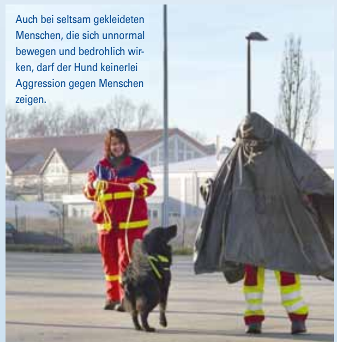
Auch bei seltsam gekleideten Menschen, die sich unnorm bewegen und bedrohlich wirken, darf der Hund keinerlei Aggression gegen Menschen zeigen.