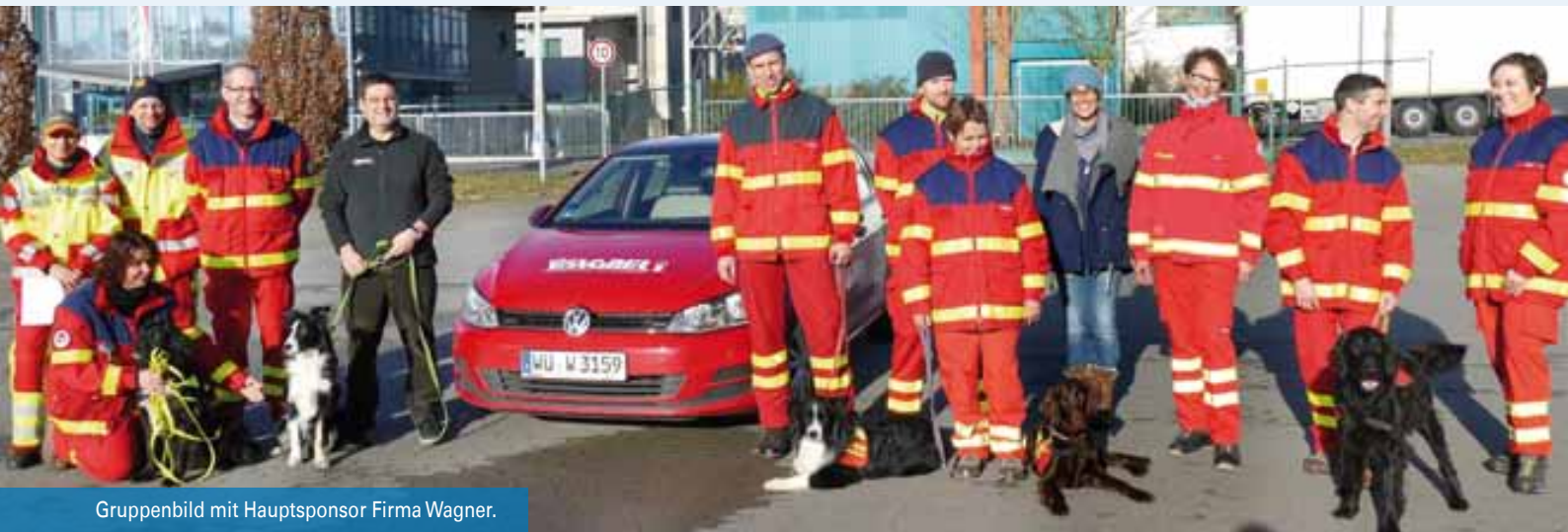
Gruppenbild mit Hauptsponsor Firma Wagner.