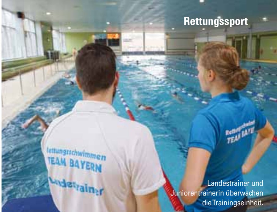
Landestrainer und Juniorentrainerin überwachen die Trainingseinheit.