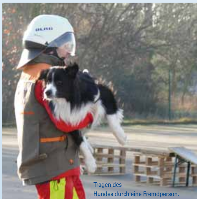
Tragen des Hundes durch eine Fremdperson.