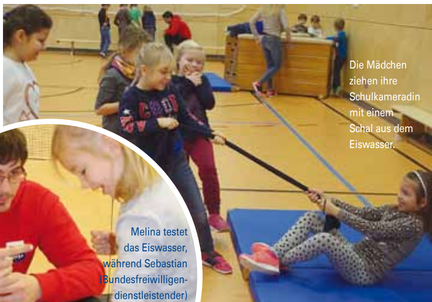
Die Mädchen ziehen ihre Schulkameradin mit einem Schal aus dem Eiswasser.