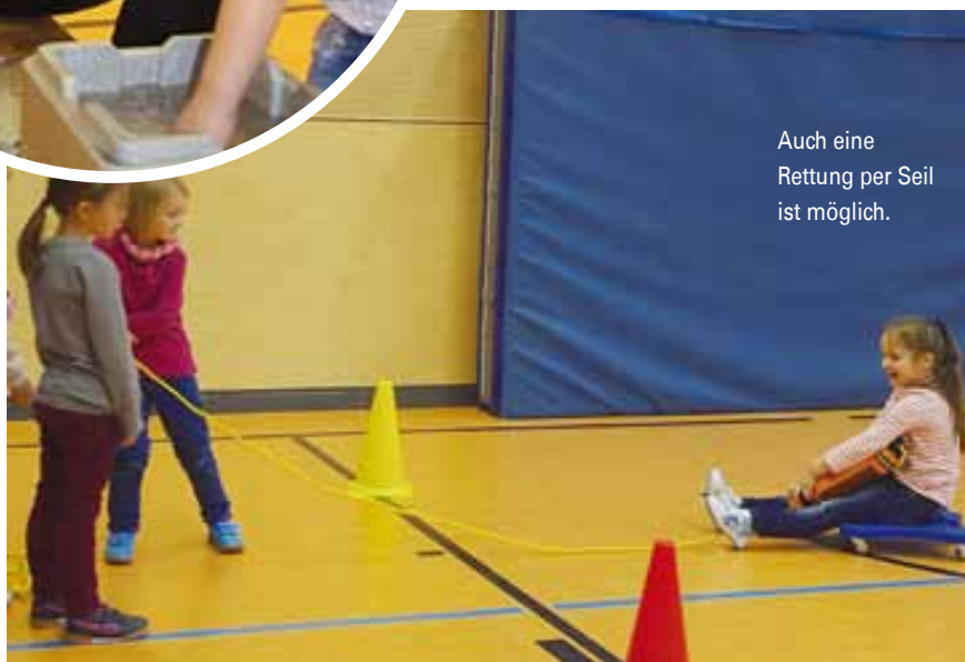
Auch eine Rettung per Seil ist möglich.