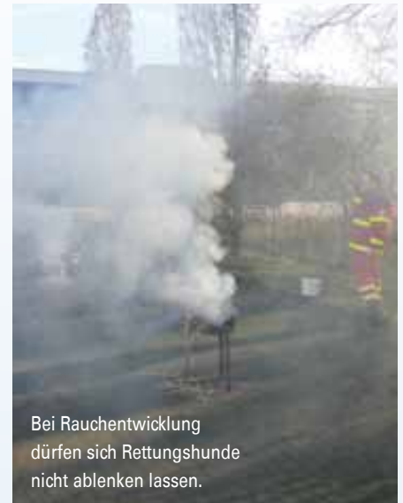
Bei Rauchentwicklung dürfen sich Rettungshunde nicht ablenken lassen.