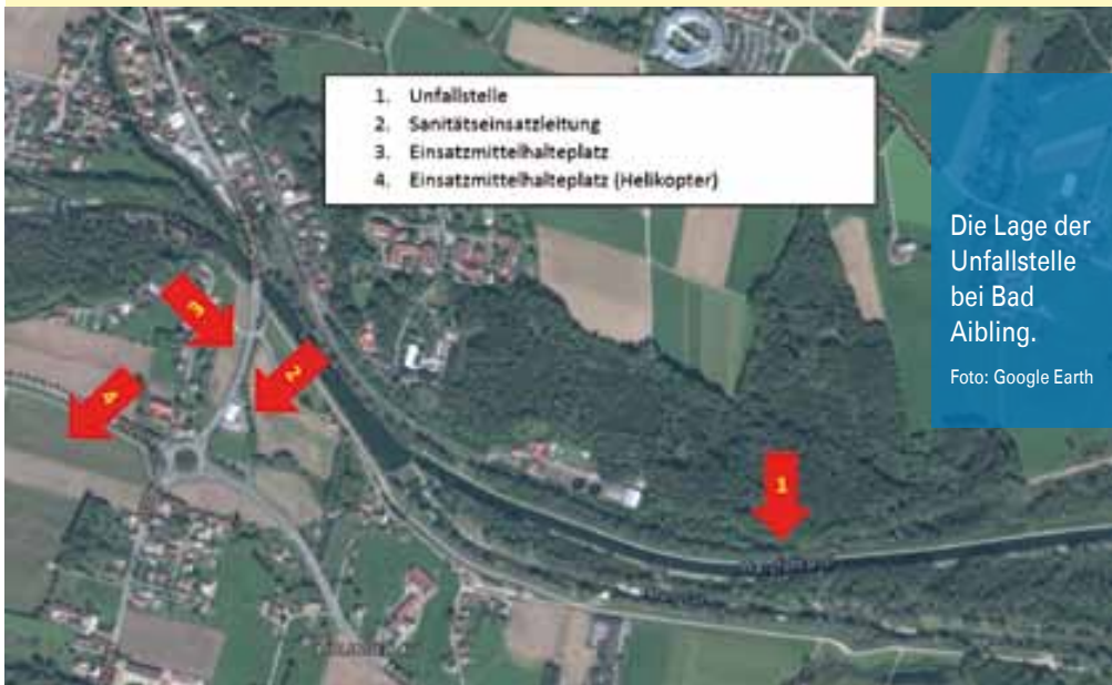
Die Lage der Unfallstelle bei Bad Aibling.