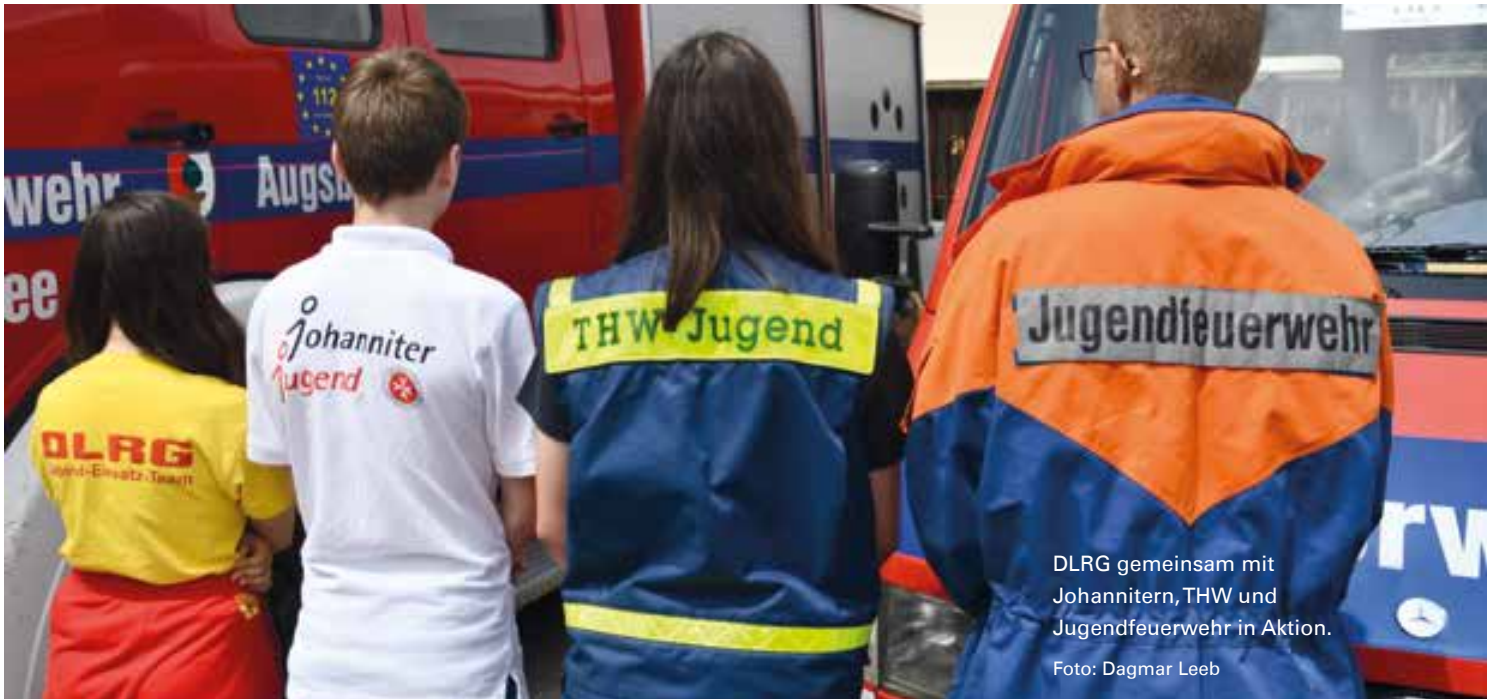
DLRG gemeinsam mit Johannitern, THW und Jugendfeuerwehr in Aktion.

Das neue Projekt zur Nachwuchsförderung in Augsburg