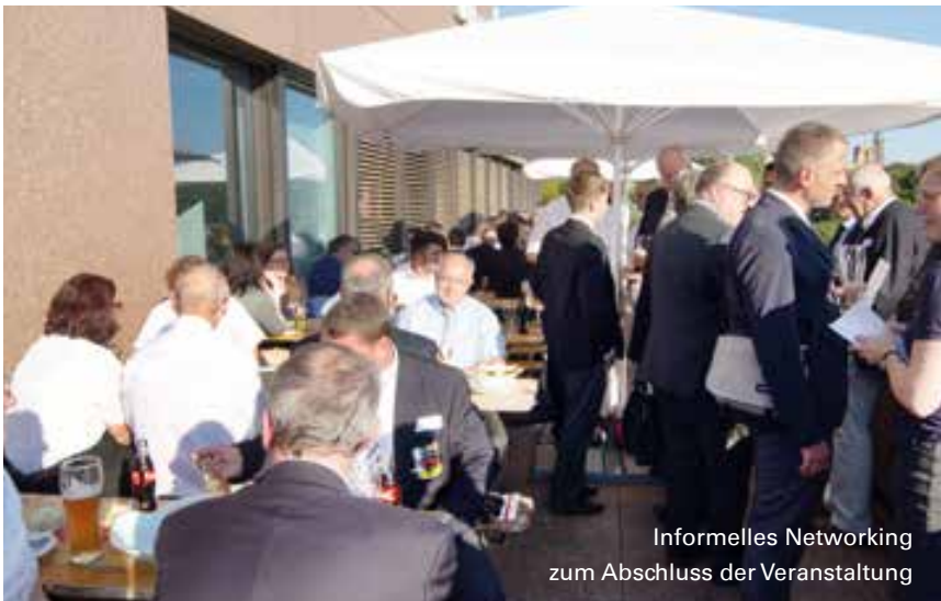
Informelles Networking zum Abschluss der Veranstaltung