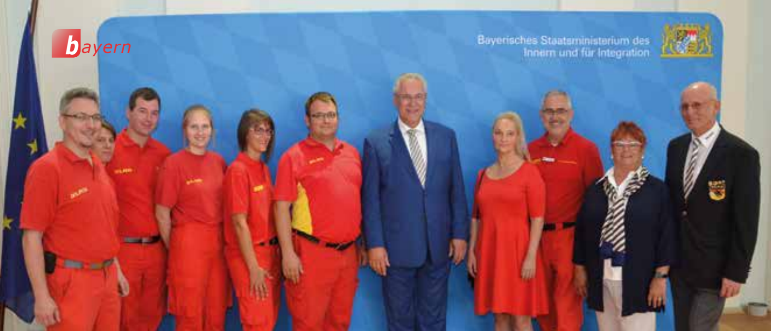
Innenminister Joachim Herrmann mit Vertretern der fränkischen DLRG in der Ansbacher Orangerie