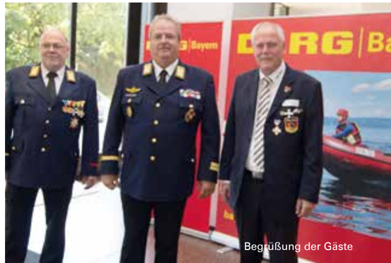
Begrüßung der Gäste