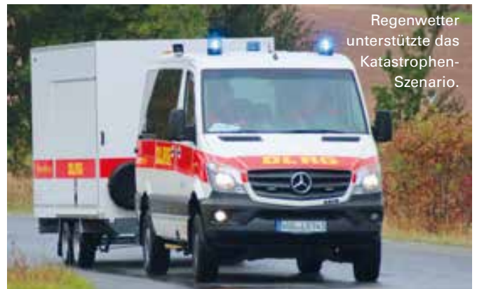
Regenwetter unterstützte das Katastrophenszenario.