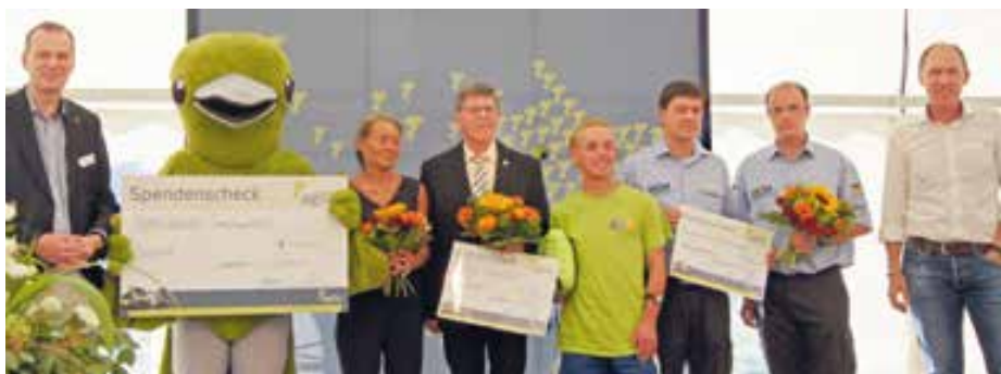
Die Vertreter der DLRG (Bildmitte) zusammen mit den weiteren Preisträgern und den Eisenbahngesellschaft.

W ir freuen uns über den 2. Preis der Aktion „Agilis kommt an“, den wir anlässlich des Werkstattfests der Agilis in Marktredwitz in Empfang nehmen durften. Mit einer großzügigen Spende würdigte die Eisenbahngesellschaft das Engagement der Burgkunstadter DLRG für ein neues Lehrschwimmbecken und die Unterstützung des Schulschwimmunterrichts der Grundschulen Altenkunstadt, Burgkunstadt und Weismain. Die DLRG Burgkunstadt stellt sich seit 15 Jahren dem Bädersterben im Landkreis entgegen, unter anderem, indem ihre agilen Mitglieder den Schwimmunterricht