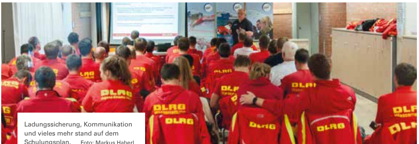
Ladungssicherung, Kommunikation und vieles mehr stand auf dem Schulungsplan.