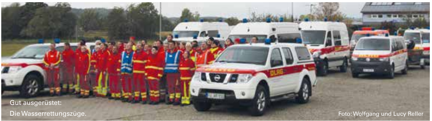
Gut ausgerüstet: Die Wasserrettungszüge.